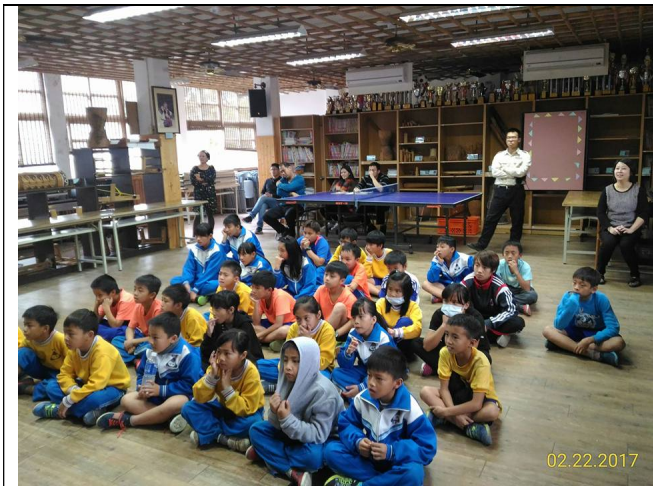
2017/2/22 苗栗縣泰安 鄉士林國小