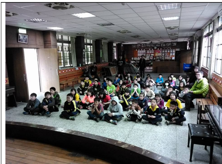
2017/3/17 花蓮縣秀林 鄉和平國小