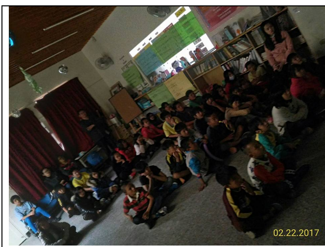
2017/2/22 苗栗縣泰安 鄉象鼻國小