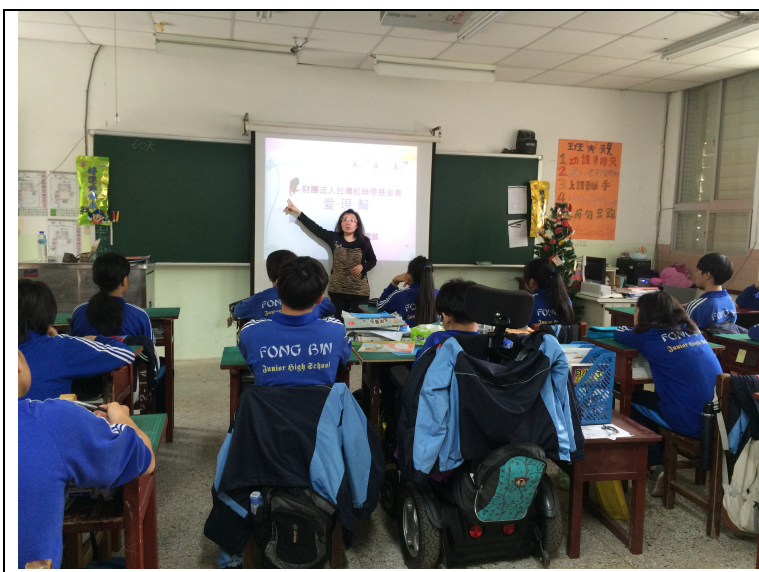
2017/3/20 花蓮縣豐濱 鄉豐濱國中