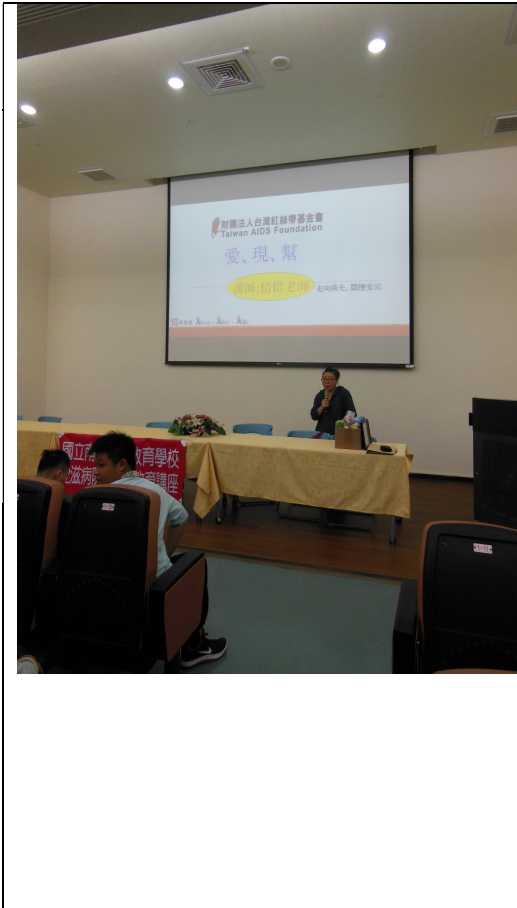
2018/03/07 南投特殊教育學校