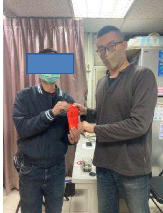
急難救助金-王 O 仲